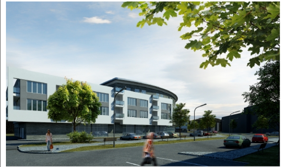
wizualizacja poglądowa osiedla